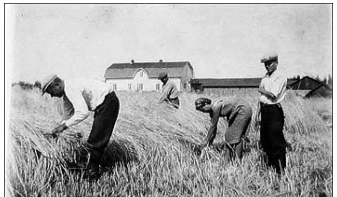
Rukiin korjuuta Liikalán pelloilla