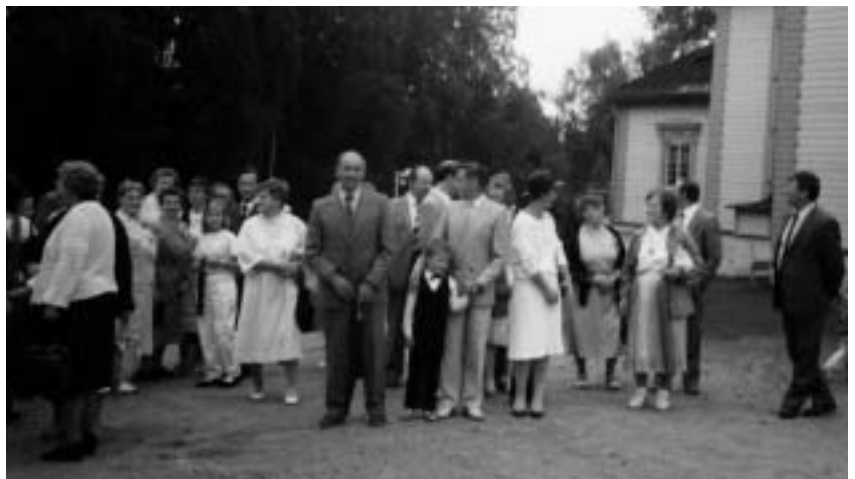
Sukuseuran perustamiskokous Mikkelin mlk:ssa 20.7.1985. Kuvassa seuraavan päivän Jumalanpalvelukseen osallistuneita sukulaisia.