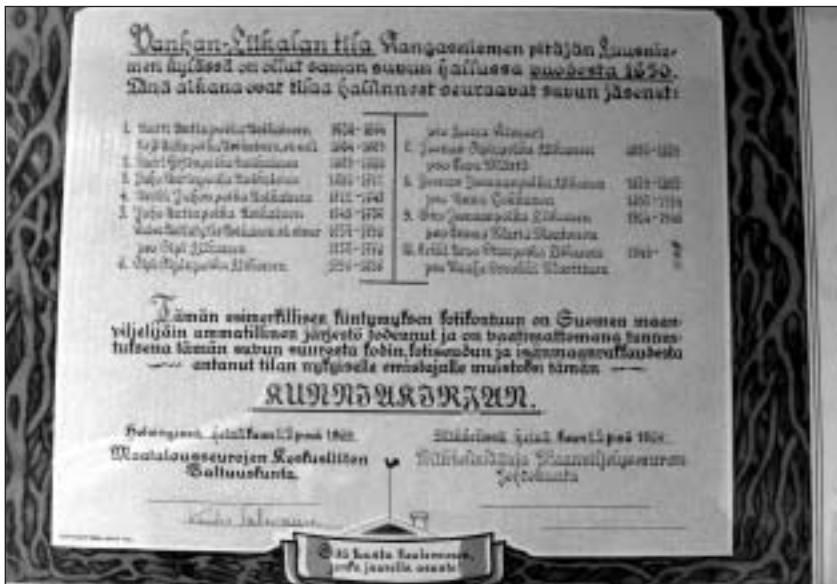
Maatalousseurojen Keskusliiton antama kunniaakirja suvun esimerkillisestä kiintymyksestä kotikontuun ja suvun suuresta rakkaudesta kotiin, kotiseutuun ja isänmaahan.