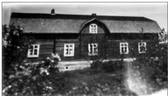
Liikalan päärakennus 1920-luvulla.