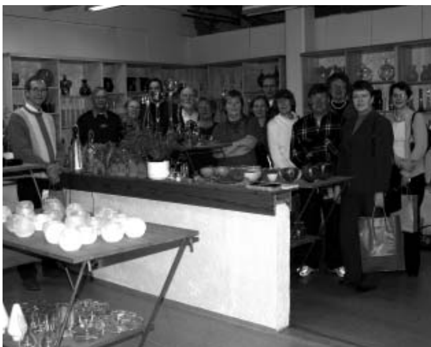
Vieraat myymälään sullottuna.