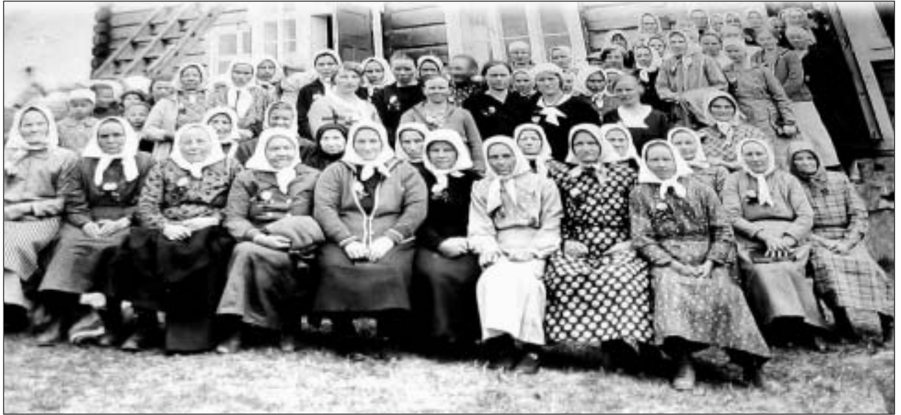
Äitienpäivät Liikalassa noin 1920-luvun puolivälissä