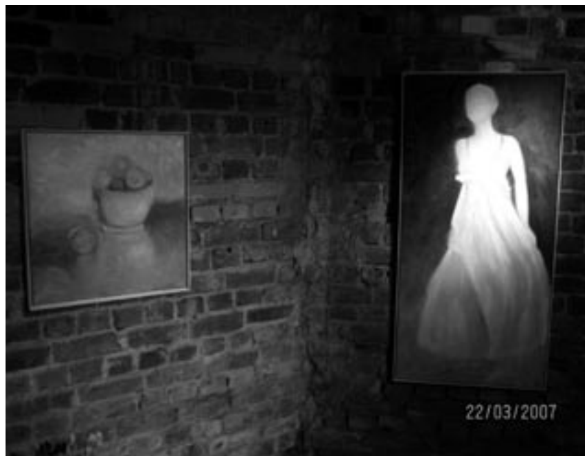
Taulut ”Keittiön pöydällä” ja ”Nainen tänään I”

lää pyrkimyksenäni tehdä näköiskuva ihmisen sielusta tai ruukkua mana- takseni esiin ruukun henki.