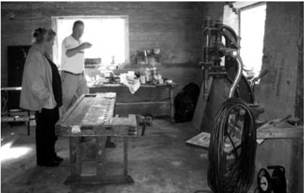
Kellarikerroksessa on tehty aikoinaan runsaasti puutöitä.