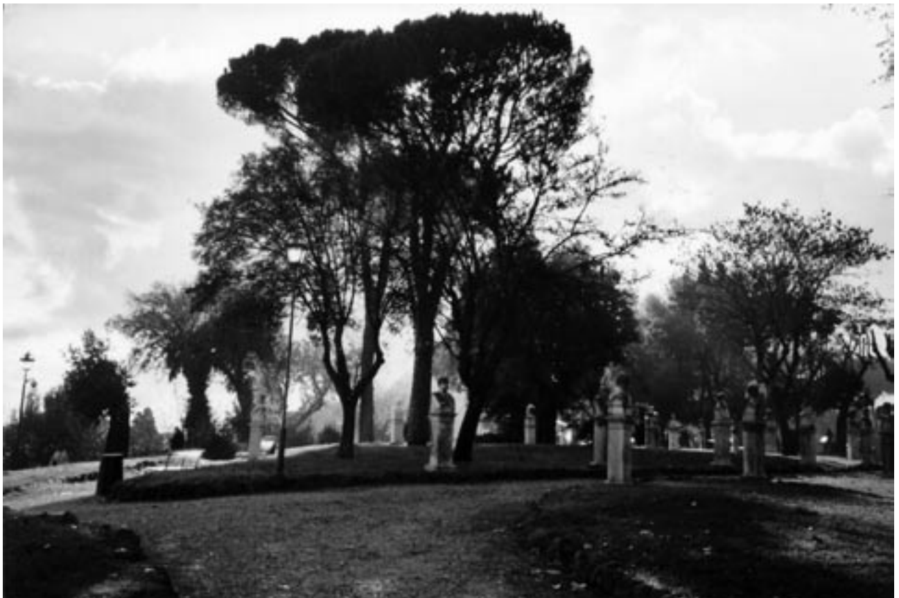
Gianicolo-kukkula ja Garibaldin soturien patsaat.