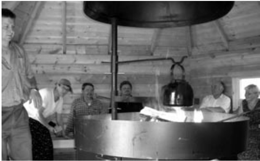
Kahvin keitossa Autiolammen kodalla.