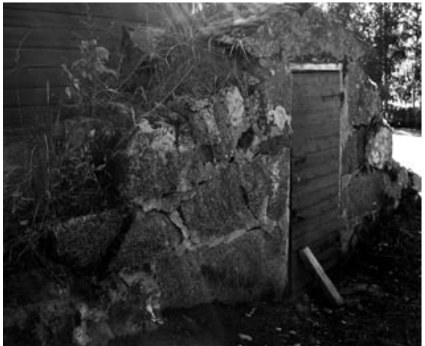
Liikalassa on myös erillinen maakellari.

Päärakennusta lämmitetään puilla. Tuvassa on iso 12 leivän leivinuuni ja talon yhteen ekovillaeri-