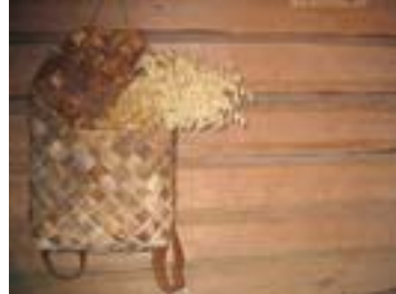
Kuvat 27-29. Aitoissa asuttiin kesällä ja säilytettiin mm. vaatteita