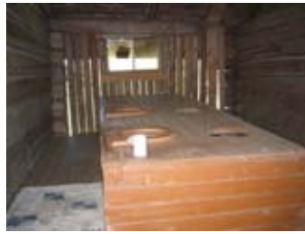
Kuvat 35-36. Liikalan puusee on päärakennusta vastapäätä olevan aitan toisessa kerroksessa, jonne pääsee kipuamaan puisia portaita pitkin. Ylhäällä avautuu keskellä aittaa suorakolmion muotoinen "laatikko", jossa on kuusi reikää.