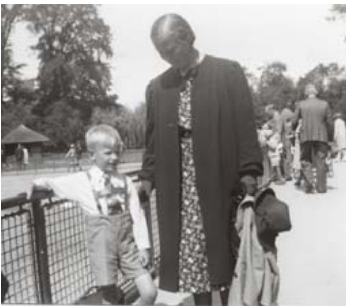
Kööpenhaminan eläintarhassa Ninan kanssa.

Kolmestaan tulimme asemalle. Sinne tuli juna, jossa oli paljon lapsia (512). Hätäännyin suunnattomasti, kun tajusin, ettei pappa ja mamma tulleetkaan mukaan. Itkin koko alkumatkan. Junassa oli hämminkiä. En surultani seurannut paljoa muita kohtalotoveritani. Junamatkasta en muista mitään. Saavuimme Ruotsin kautta Tornioon 25.9.1943. Minun numeroni oli 1519 kansallisarkiston mukaan. Tuntui kuin elämä olisi vähäksi aikaa pysähtynyt.