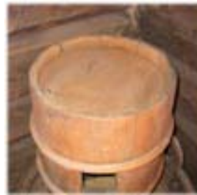
Kuvat 37-40. Aitassa säilytettiin työkaluja. Alarivin oikealla olevasta kuvasta löytyy väline, jolla tehtiin sammioita, joissa säilytettiin lihaa, kalaa ym.