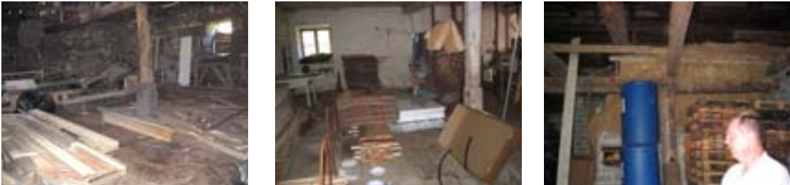
Kuvat 45-47. Vanha navetta ei ole tällä hetkellä enää käytössä, sauna toimii mainiosti joka päivä.

Pellolla kasvoi ruista, kauraa ja ohraa. 1930-luvulla alettiin myös viljellä vehnää. Perunoita, porkkanoita ja lanttua kasvatettiin ja metsästä poimittiin mustikoita ja puolukoita. Kaloja saatiin vihtamerroilla tai verkoilla järvestä. Ne suolattiin isoihin sammioihin tai kuivattiin. Kalojen perkaaminen oli yleensä sunnuntain töitä.