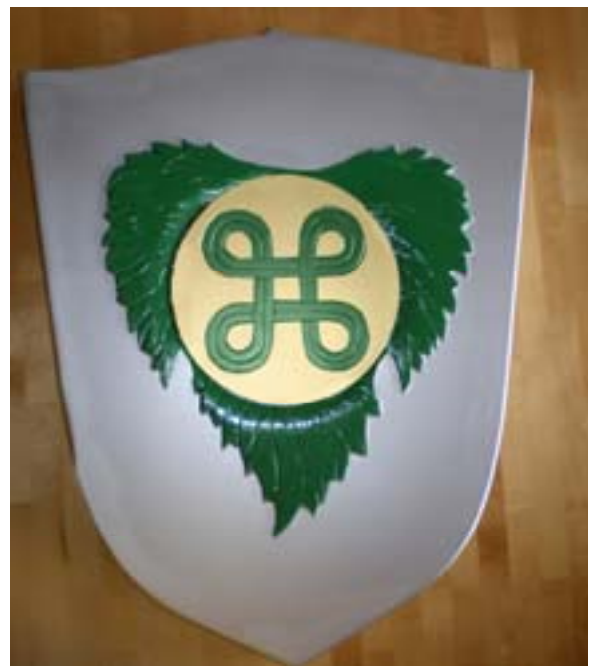
"Puhuva vaakuna" Hannun vaakuna