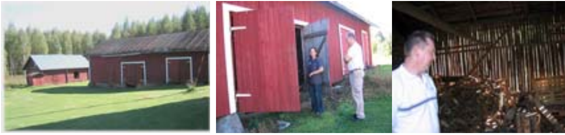
Kuvat 32-44. Vasemmassa kuvassa on takana vanha sauna ja oikealla liiteri. Oikealla on Liikalan puuliiteri, jonka toisessa päässä on aitta. Takana vasemmalla olevassa vanhassa saunassa ovat syntyneet monet Liikalan talon lapsista.