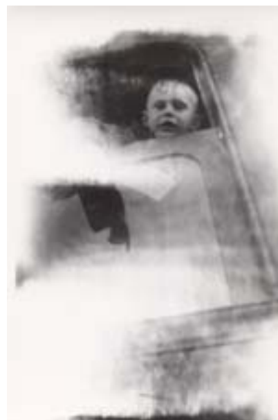
Elämäni vaikein hetki. Lähtö Soröstä.