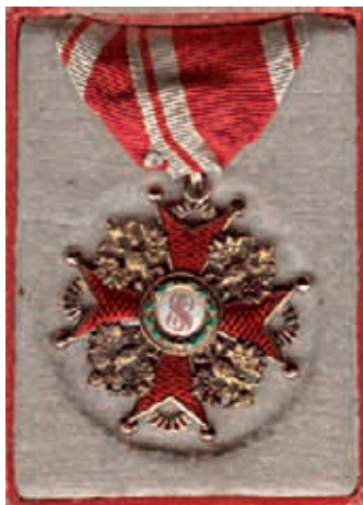
Pyhän Stanislauksen kunniamerkki

Pyhän Annan ritarikunnan on perustanut Schlesvig-Holsteinin herttua Kaarle Frederik vuonna 1735 ja Pyhän Stanislauksen ritarikunnan Puolan kuningas Stanislaus August vuonna 1765.