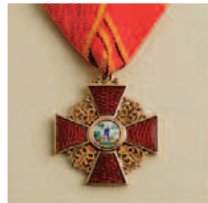
Pyhän Annan 3. luokan kunniamerkki

Schlesvig-Holsteinin herttua Kaarle Fredrik perusti 3.3.1735 Pyhän Annan ritarikunnan. Ritarikunta on omistettu herttuan vaimon Annan muistolle. Keisari Pietari III aikana jaettiin tämän ritarikunnan tunnusmerkkejä runsaasti Venäjällä, mutta keisarinna Katariina II ei pitänyt tästä ritarikunnasta ja jakoi tunnuksia harvakseltaan. Käskykirjeellään 5.4.1797 Paavali I nimitti tämän ritarikunnan venäläiseksi ritarikunnaksi .