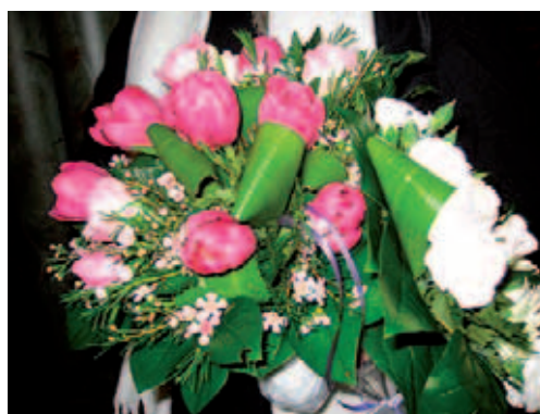
Kertun arku ja sukuseuran kukat