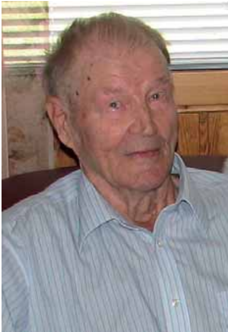
Kuva vuodelta 2008