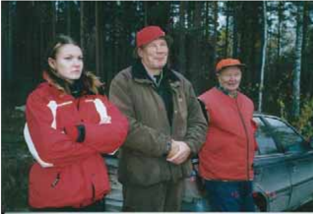
Metsästäjiä kolmessa polvessa.