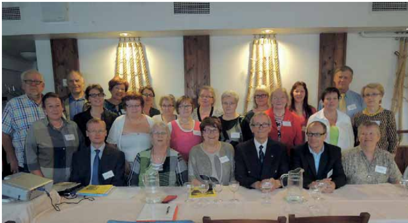
Me olimme siellä. Kuvaaja Anne Ekroos vasemmalta toinen.