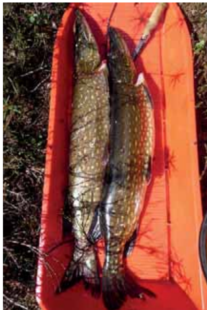
Pulkan mittaiset hauet.

Sukulointien lisäksi kesän parhaimpia muistoja tuli aivan arkipäiväisistä asioista. Muun muassa työmatkasta, joka oli hieman normaalista poikkeava. Ensin soudettiin toiselle puolelle, sitten seurasi kävelyä puolisen kilometriä tukkitietä ylöspäin ja lopuksi autolla ajoa noin 30 km/suunta. Keran kävi töihin lähtiessä hullusti, kun veneeseen noustessa jalka lipesi ja olin räähällä vedessä. Housuthan siinä meni vaihtoon! Toisinaan soutuessa käytiin tuulen kanssa taistoa, kumpi on vahvempi.