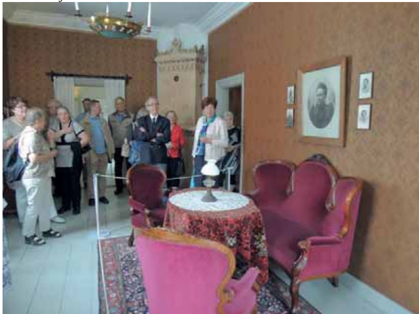
Korttelimuseossa löytyi tällainenkin näkymä.