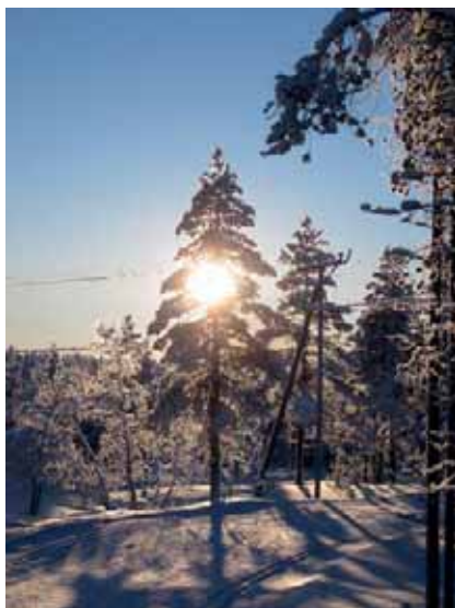
Maisema ladun varrelta.

On talvi 1991, olen 4 vuotta, isä antoi ehdot, että ensin täytyy hiihtosuksilla opetella tekemään aura ja sitten vasta pääsisi laskettelurinteeseen. Näin toimittiin. Autotallin edessä laskettiin hiihtosuksilla, tampattiin ylös ja taas uudelleen alas niin kauan, että homma luonnistui kunnolla. Ensi kokemukset lasketteluun ovat kotirinteestä Viitasaaren Savivuorella aurakäännöksistä aina kaatumisharjoituksiin. Syytän hyvällä tavalla vanhempiani siitä, että minuun on iskenyt jonkin sortin Lapin kuume.